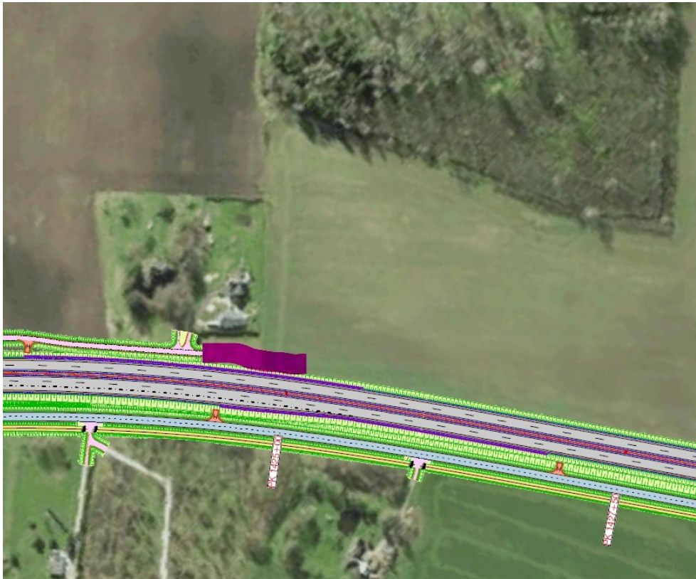
Joonis 1. Riigitee projektiga kavandatava kogujatee ühendamise planeeringuga kavandatava teega, väljavõte riigitee projekti tugiplaanist